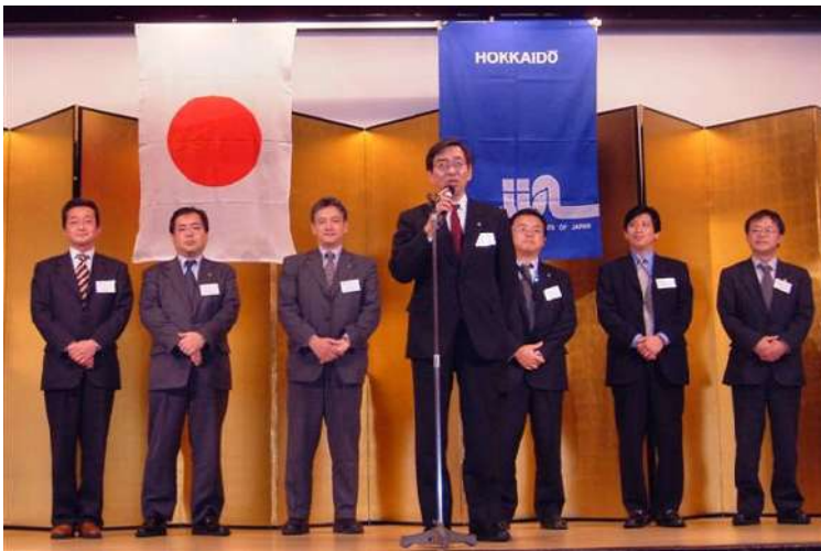
■アラカツヨ 損保ジャパン