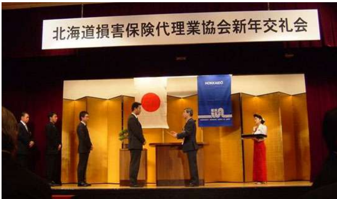
■日本代協認定保険代理証授与