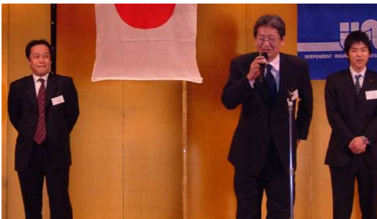
■ アラクツヨ ニッセイ同和