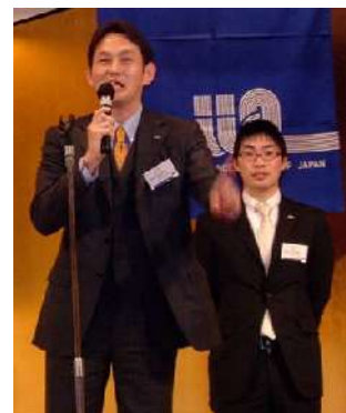
■アラクツヨ アメリカンホーム保険