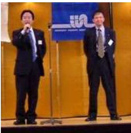
■アラクツヨ エース保険