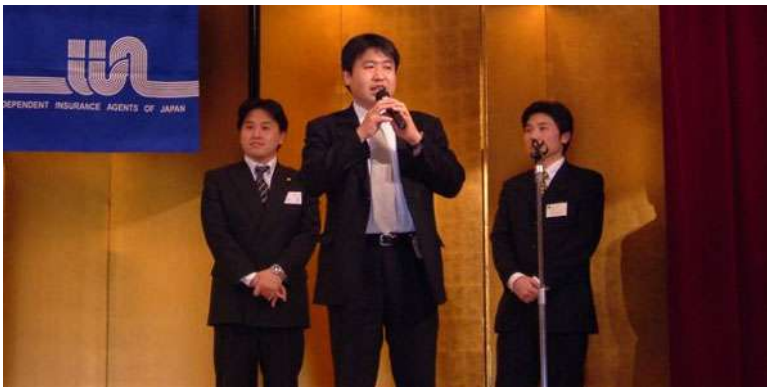
■ アラクツヨ 東京海上日動