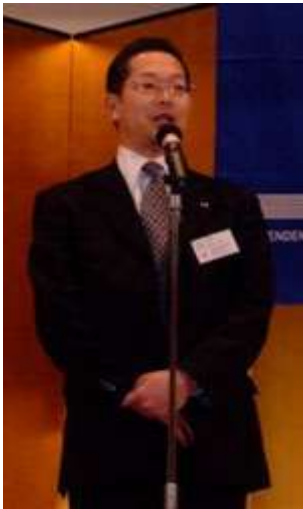
■アラクツヨ 日新火災