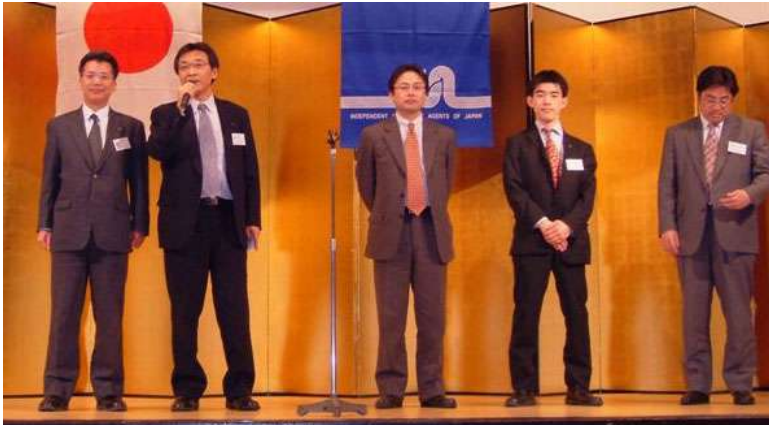
■アラクツヨ 日本興亜