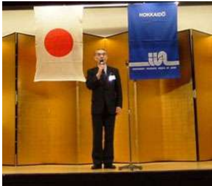
■アラクツヨ 三井住友