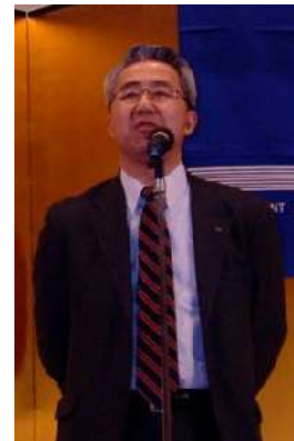
■アラカツヨ あいおい