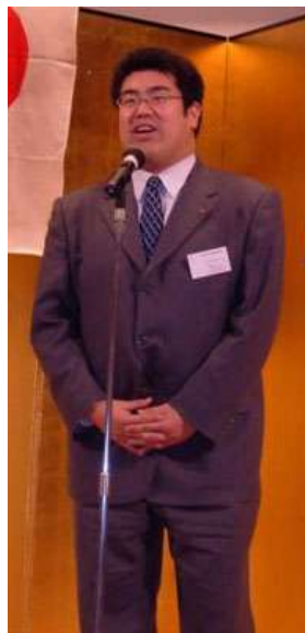
■アラクツヨ 共栄火災